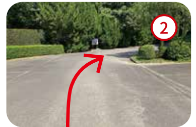
2 突き当りを右折し第2駐車場へ