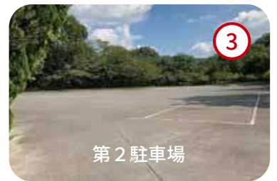
3 第2駐車場に車を駐車します