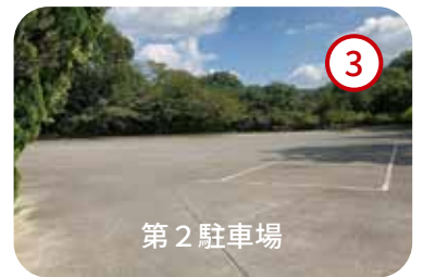
3 第2駐車場に車を駐車します