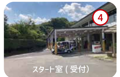
4 キャディバッグをスタート室へお持ちください