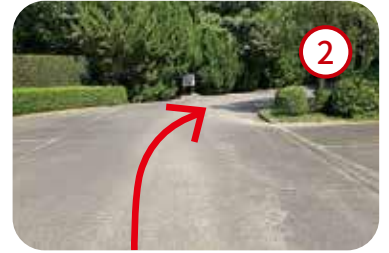
2 突き当りを右折し第2駐車場へ