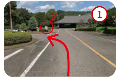
1 クラブハウス前を左折し第1駐車場を通過します